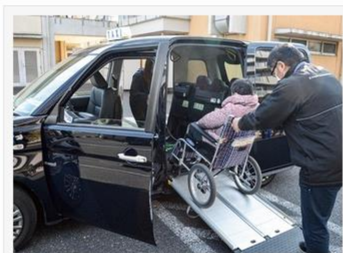
車いすでの乗降を体験した

UDタクシーは広い車内空間や乗降口のスロープ設置など、車いす使用者やベビーカー利用の親子連れなどでも乗りやすく設計された車両。