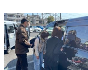
▲体験乗車で大喜び、自信につながった