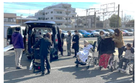
▲会場となった駐車場 車いすユーザーも多く集まった

実際に試していただくことで安心感を持ってもらえ、実利用にもつながったことは成果である。