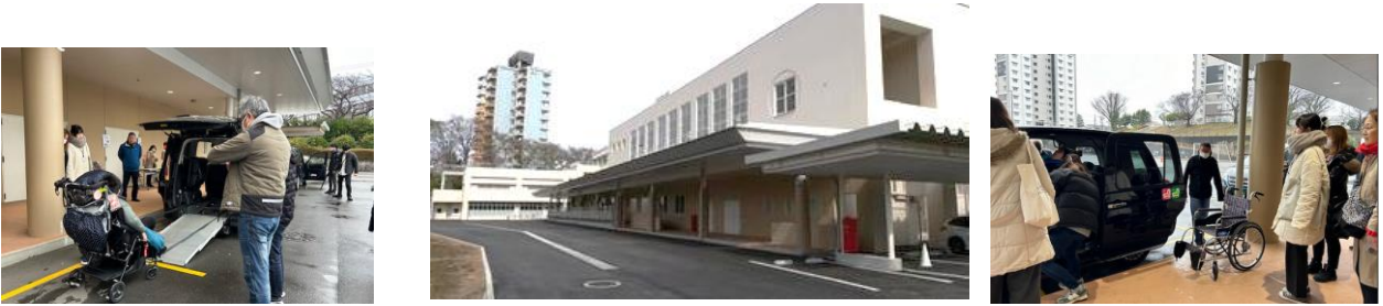
横浜市立左近山特別支援学校

雪予報の中での開催でしたが、3名の大型バギーを使用されているお子さんやご家族、現場の支援相談員さんたちが参加されました。